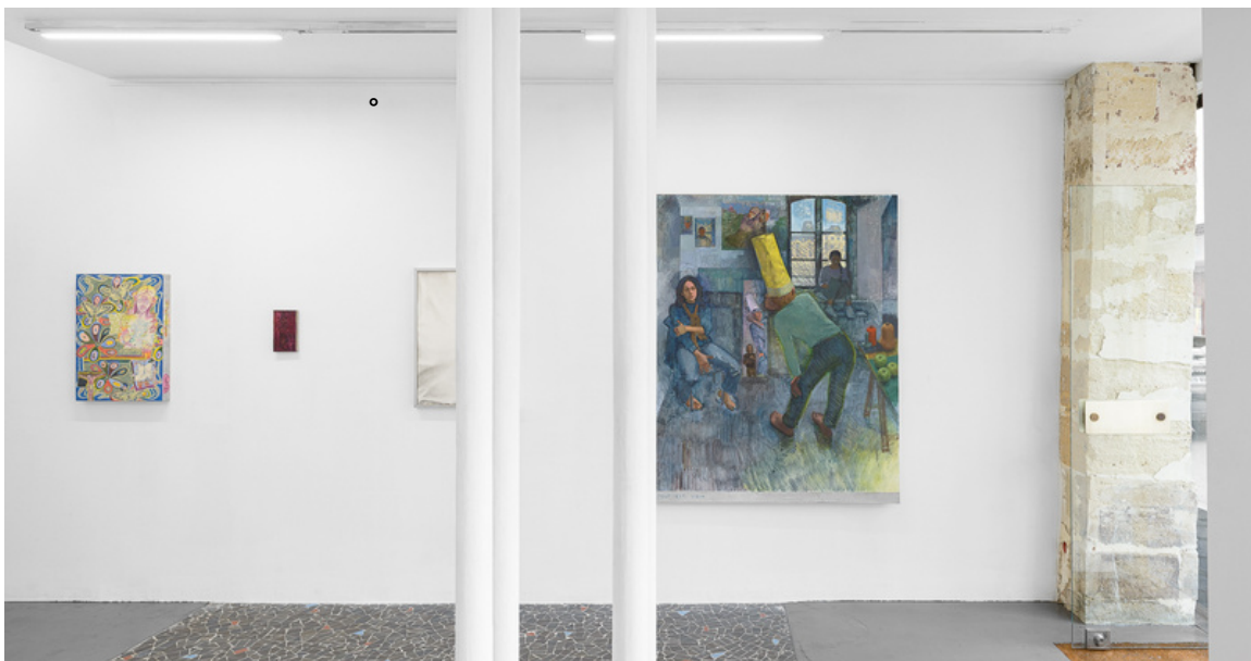
SUITE N°1, vues d'exposition, Galerie John Ferrère

Tout au long de l'exposition, une série de concerts et de performances, en dialogue avec les oeuvres exposées, sera proposée dans les trois espaces de la galerie.