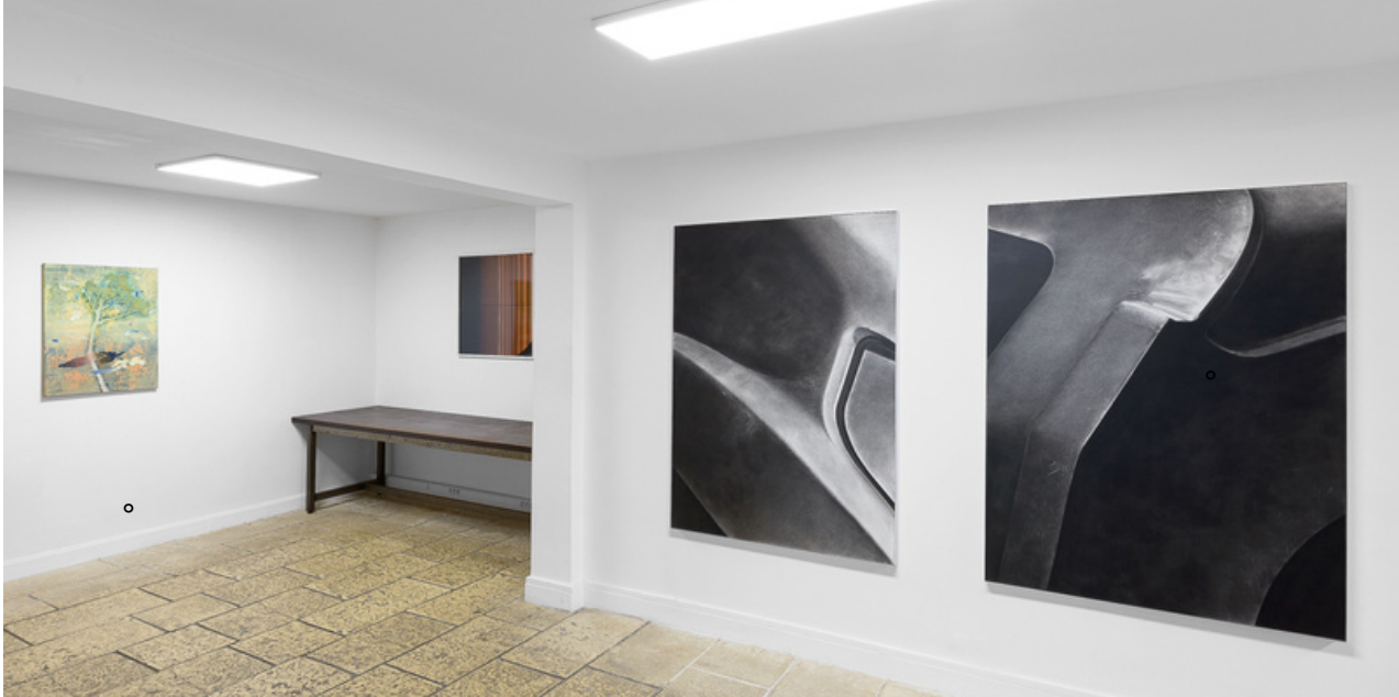
SUITE N°1, vues d'exposition, Galerie John Ferrère