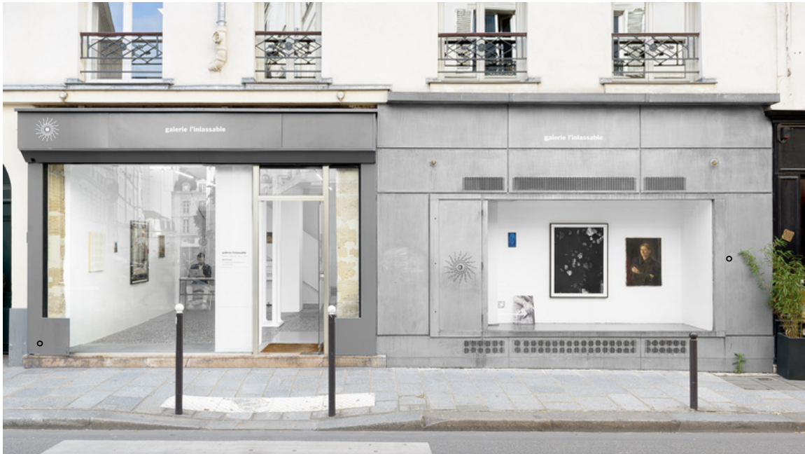
SUITE N°1, vues d'exposition, Galerie John Ferrère

La Galerie John Ferrère a le plaisir de vous convier à l'exposition SUITE N 1, du 12 mai au 24 juin au 18, rue Dauphine.