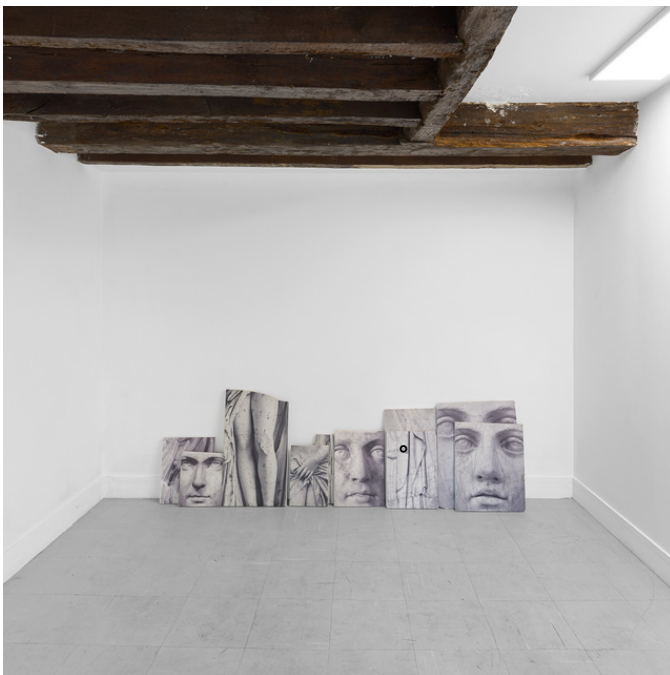
SUITE N°1, vues d'exposition, Galerie John Ferrère